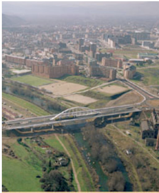
Puente de Ponferrada