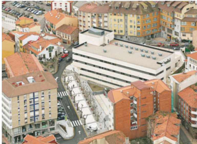
Centro Polivalente Candás, Asturias

Desaladora San Pedro del Pinatar, Murcia