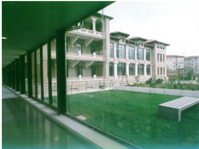
Hospital Marqués de Valdecilla, Santander