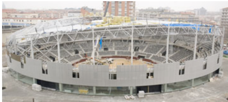
Plaza de toros de Vitoria